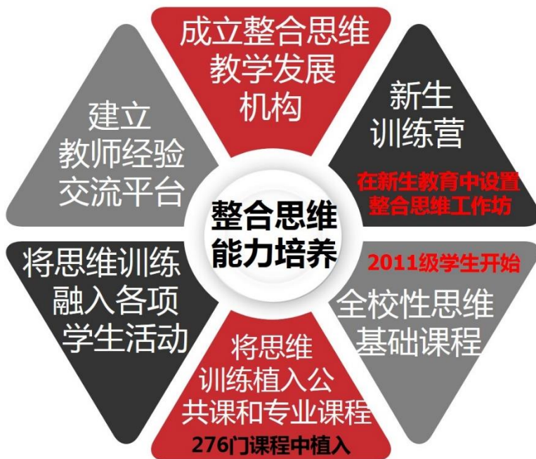
图 1：汕头大学整合思维能力培养模式

一是成立整合思维教学发展机构。自 2010 年以来，整合思维全校性思维基础课程项目已经形成了成熟的由大班课老师和小班课助教联合构成的教学发展机构。大班课讲师由在思维教学领域有一定经验积累的博士担任，助教团队稳定在 8-9 名全职助教（硕士学历占半数以上）、2-3 名半职助教的规模，并注重团队成员构成的异质性和多样化。