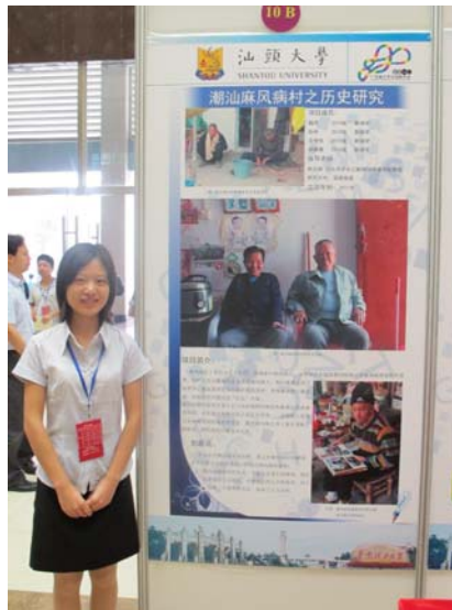
（《潮汕地区麻风病村之历史研究》项目获年会“最受欢迎项目”）

年会闭幕式于 21 日下午在华工励吾科技大楼国际会议厅举行。我校教务处处长陆小华作为专家代表被邀在会上做了精彩报告。同时，闭幕式邀请了曾担任上海世博会中国馆总设计师的何镜堂院士进行演讲，何院士提出了“国家的强大必须依靠创新，而创新来源于坚持”的观点，他强调，“创新必须从青年开始，要学会逐渐形成自己的创新思维和理念，学会组建创新团队，并有共同的理想和目标。”