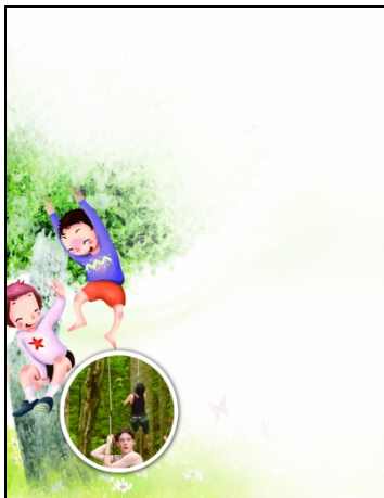
美国康奈尔大学的爬树课教学现场

爬树，是很多调皮的孩子童年的记忆。最近，厦门大学微博协会发微博称，厦大将开设爬树选修课，在这门课上，可以教学生如何安全爬上任何树，并在上面自由移动，甚至可以“在树木之间灵活穿梭”。网络上，关于“爬树选修课”的微博铺天盖地，有人赞同有人反对。昨天下午，扬子晚报记者采访了厦大教授爬树课的老师，对方表示，目前已经开始在学校本部后山寻找合适的场地，预计新学期开课。